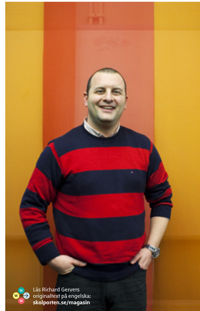
Läs Richard Gervers originaltext på engelska: skolporten.se/magasin

Det förvånar mig att västvärlden har blivit besatt av Pisas ligatabeller, och att vi är så desperata att vi måste ge prov efter prov efter prov – tills dess att vi kan konkurrera med Finland och Asien. Detta medan Finland och Asien är på väg bort från ett provbaserat skolsystem, mot mer individualiserade utbildningssystem, som är utformade för att undersöka och utveckla människans potential. Jag säger inte att vi inte bör bedöma våra barn