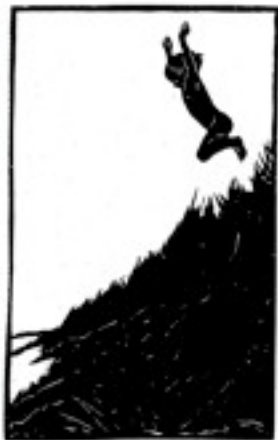
Des Trier March: "Springet"