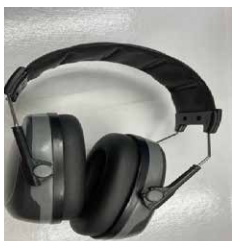
Hörselkåpor för att avgränsa yttre stimuli