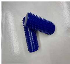
Fotrulle med pigg