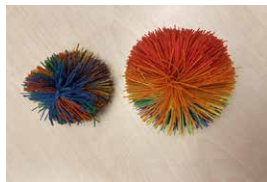
Taktila hjälpmedel: lera, koosboll, triangels, bitring, skumgummikub, tyglabyrintmed kula