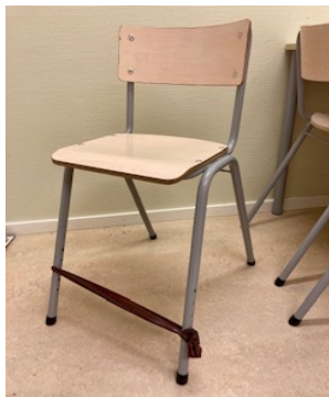
Gummiband för fotaktivitet