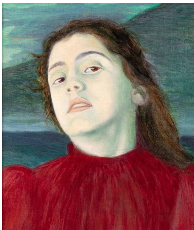
Figur 4: Bror Lindh (c:a 1894) "Säv, säv, susa".

Eleverna får diskutera vad de ser på bilden, vilka färger de ser, beskriva kvinnan och landskapet, försöka sätta ord på målningens stämning, känsla och vad de själva tycker om den. Därefter förklaras målningens uppkomst och varifrån Lindh fått inspiration. "Säv, säv, susa" är en av de mer svårtillgängliga av de dikter mina elever får läsa. Jag låter den ta den tid den behöver. Högläser den med känsla. Förklarar ord. Pekar mot allitterationen och förklarar hur s-ljuden härmar sävens susande. Pekar på assonanser och hur å-ljuden påminner om vågor som slår. Berättar om mysteriet som dikten inleds med, frågan som i desperation ställs till vågorna, till säven, och vad svaret berättar om Ingalills olyckliga öde. Efter en grundlig genomgång tittar vi på videon "Highlights ur samlingarna – Bror Lindh" (Värmlands museum, 2019) där tavlan presenteras tillsammans med dess koppling till Frödings dikt. Videon fungerar som en sammanfattning av det vi diskuterat under lektionen.