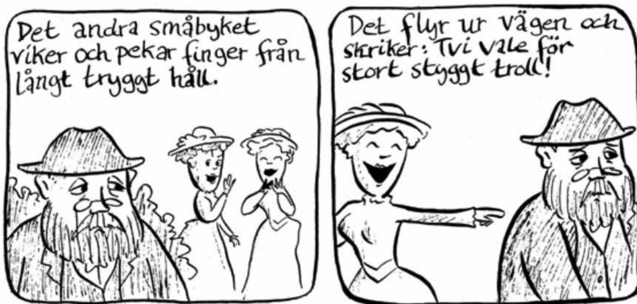
Figur 2: Malin Biller (2014) "Ett gammalt bergtroll", ur "I varje droppe är en ädelsten". Publicerat med tillstånd från konstnären.

Eleverna får till sist diskutera frågorna "Om bergtrollet är ett självporträtt av Gustaf Fröding, hur ser Fröding på sig själv?" och "På vilka sätt handlar dikten om utanförskap?"