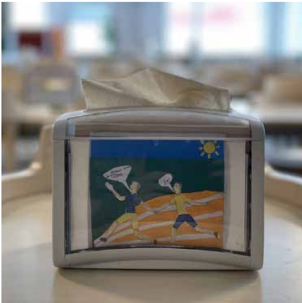
Bild 10: Exempel på elevarbete i servetthållaren i matsalen. Den ena eleven tar den andra i hand vid målgången och säger "Vi kommer klara av Boo Gårds loppet! Ja, svarar den andra.

och visualisera skolans vision användes serieformat i bilduppgiften. Två elever för en dialog med hjälp av pratbubblor mot en färgglad bakgrund. Bilderna visar upp en positiv situation där den ena eleven har lärt sig något i skolan som inspirerar den andra eleven (se bild 8 och 9).