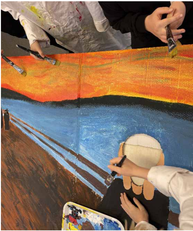
Bild 4 (till vänster): Elever målar på vikkväggen. Bild 5 (till höger): Elev kikar ut genom hålet.